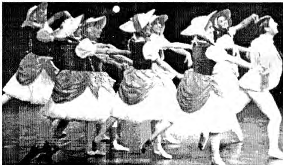
Esta imagen se refiere a la versión coreográfica de Frederick Ashton presentada en el Coven Garden de Londres de 1960.

Ballet en dos actos y tres escenas. Libreto y coreografía de Jean Dauverbal. Música de autor desconocido. Estreno: Burdeos, Grand Theatre, 1 de julio de 1789. Repuesto en 1928 en la Ópera de París con música de Louis-Joseph-Ferdinand Hérold.